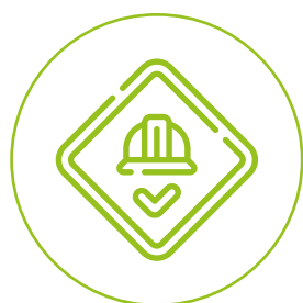
BEZPIECZNE ŚRODOWISKO PRACY