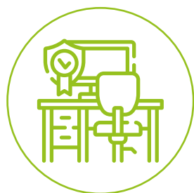
PRZYJAZNE ŚRODOWISKO PRACY