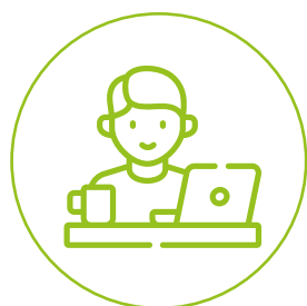
ODPOWIEDZIALNOŚĆ ZA MIENIE