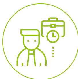
ETYKA POZA PRACĄ