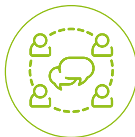
KOMUNIKACJA Z PRACOWNIKAMI