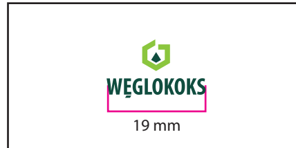
1 Wersja barwna

Wersje w kontrze wymiar podstawy logo 22 mm. Należy zwrócić uwagę na warunki technologiczne odwzorowania logo, dobierając wymiar minimalny tak aby uniknąć "zalewania" elementów logo przez tło.