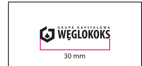
3 Wersja achromatyczna czarna