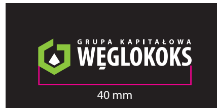
4 Wersja barwna - kontra