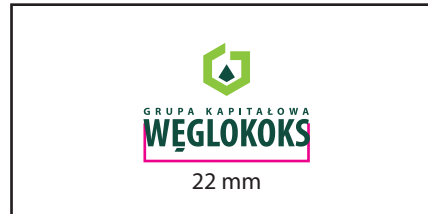
1 Wersja barwna

Wersje w kontrze wymiar podstawy logo 35 mm. Należy zwrócić uwagę na warunki technologiczne odwzorowania logo, dobierając wymiar minimalny tak aby uniknąć "zalewania" elementów logo przez tło.