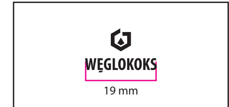
3 Wersja achromatyczna czarna