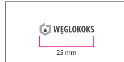
2 Wersja monochromatyczna