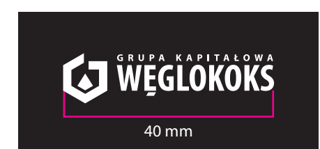
6 Wersja achromatyczna - kontra