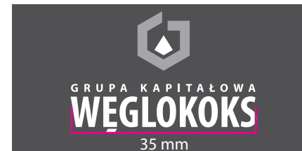
5 Wersja monochromatyczna - kontra