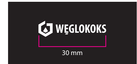
6 Wersja achromatyczna - kontra