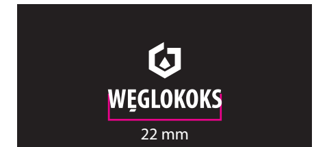
6 Wersja achromatyczna - kontra