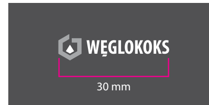
5 Wersja monochromatyczna - kontra