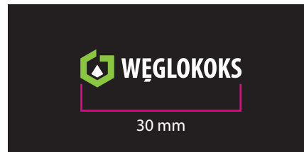
4 Wersja barwna - kontra