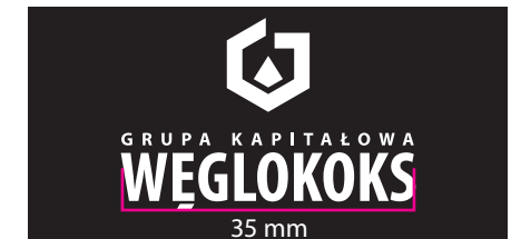
6 Wersja achromatyczna - kontra