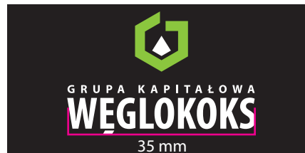
4 Wersja barwna - kontra