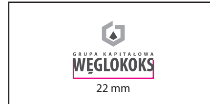
2 Wersja monochromatyczna