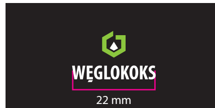
4 Wersja barwna - kontra