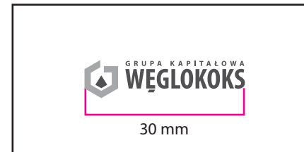
2 Wersja monochromatyczna