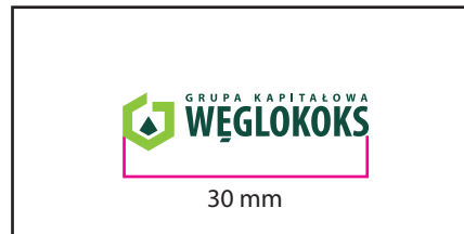
1 Wersja barwna

Wersje w kontrze wymiar podstawy logo 40 mm. Należy zwrócić uwagę na warunki technologiczne odwzorowania logo, dobierając wymiar minimalny tak aby uniknąć "zalewania" elementów logo przez tło.