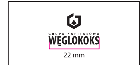
3 Wersja achromatyczna czarna