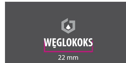
5 Wersja monochromatyczna - kontra