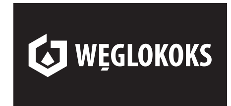
6 Opcja achromatyczna - kontra