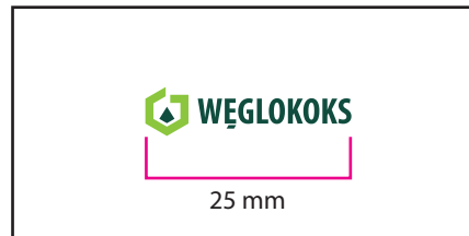
1 Wersja barwna

Wersje w kontrze wymiar podstawy logo 30 mm. Należy zwrócić uwagę na warunki technologiczne odwzorowania logo, dobierając wymiar minimalny tak aby uniknąć "zalewania" elementów logo przez tło.