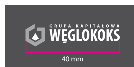
5 Wersja monochromatyczna - kontra