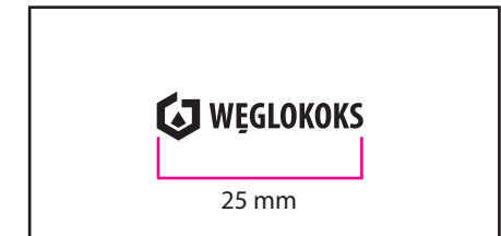
3 Wersja achromatyczna czarna