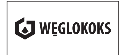
3 Opcja achromatyczna czarna